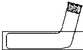
図 試験容器の形状

試験液を入れた石英試験管（下図）を人工光照射装置内に置き 25±1℃で最大 16 時間照射した。暗対照試料は石英又はパイレックス製容器を用い、遮光下で同じ温度で静置した。